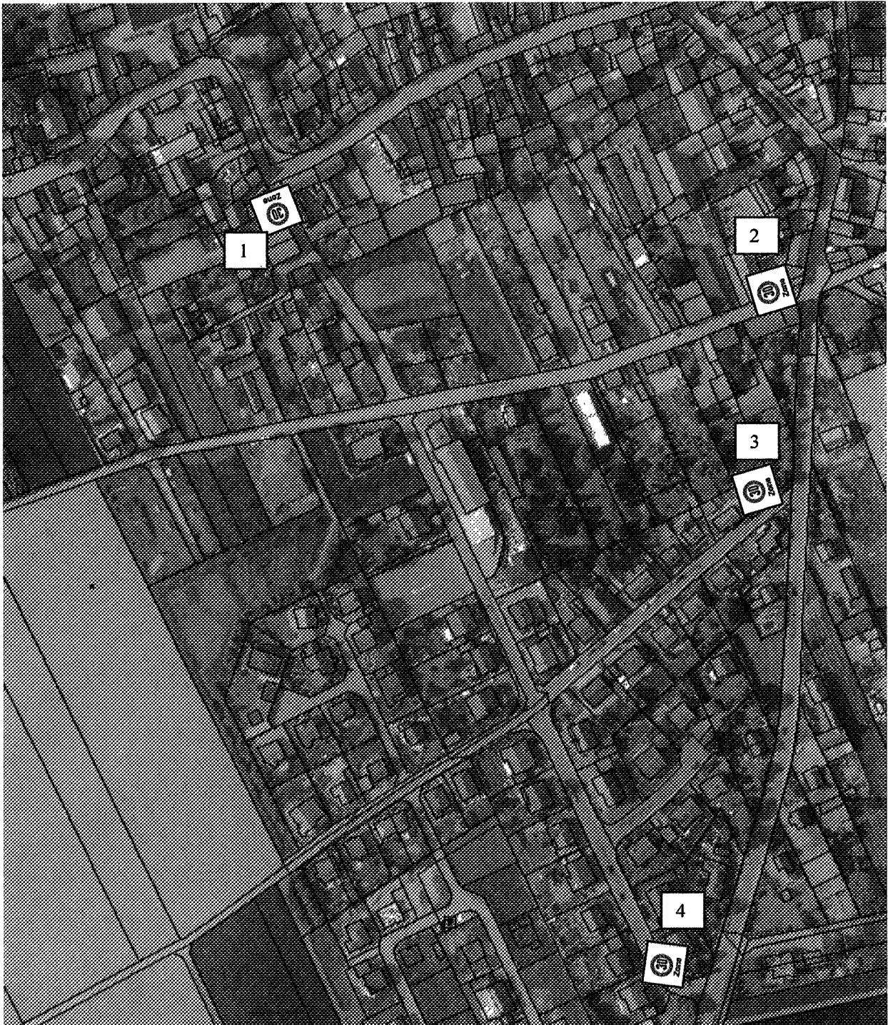
Planskizze zur Verkehrsbehördlichen Anordnung vom 18.05.2017 für Ilbesheim