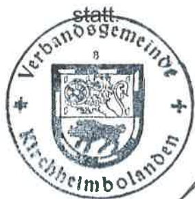
(Röß) Erster Beigeordneter

Donnerstag, 15. Januar 2026, 19.00 Uhr, im Dorfgemeinschaftshaus, Hauptstraße 12 in Rittersheim