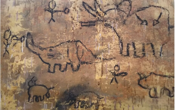
Diese Kohlezeichnung stammt zwar nicht aus der Steinzeit, ist aber auf Birkenrinde gemalte Kunst, die nachempfunden, welche große Bedeutung die Jagd auf Mammute für unsere Vorfahren hatte.

Für Dienstag, 27. September 2022, 16:00 bis 17:30 Uhr, lädt das Museum im Stadtpalais, Amtsstraße 14, die Kinder aus Kirchheimbolanden und Umgebung im Alter von sechs bis zwölf Jahren ganz herzlich zum Projektnachmittag ein. Wir werden erforschen, wie die Menschen der Steinzeit ihre Waffen herstellten, welche großen und kleinen Tiere sie jagten und welche Tricks sie dabei anwendeten. Passend zum Thema wird auch ein Kreativworkshop angeboten. Ein geringfügiger Materialkostenbeitrag wird erhoben. Die dann geltenden Abstandsregeln werden natürlich eingehalten. Wir bitten um das Mitbringen einer Mund-Nasen-Maske, sollte diese wieder nötig sein. Wer teilnehmen möchte, melde sich bitte unter paedagogik@museum-kirchheimbolanden.de an.